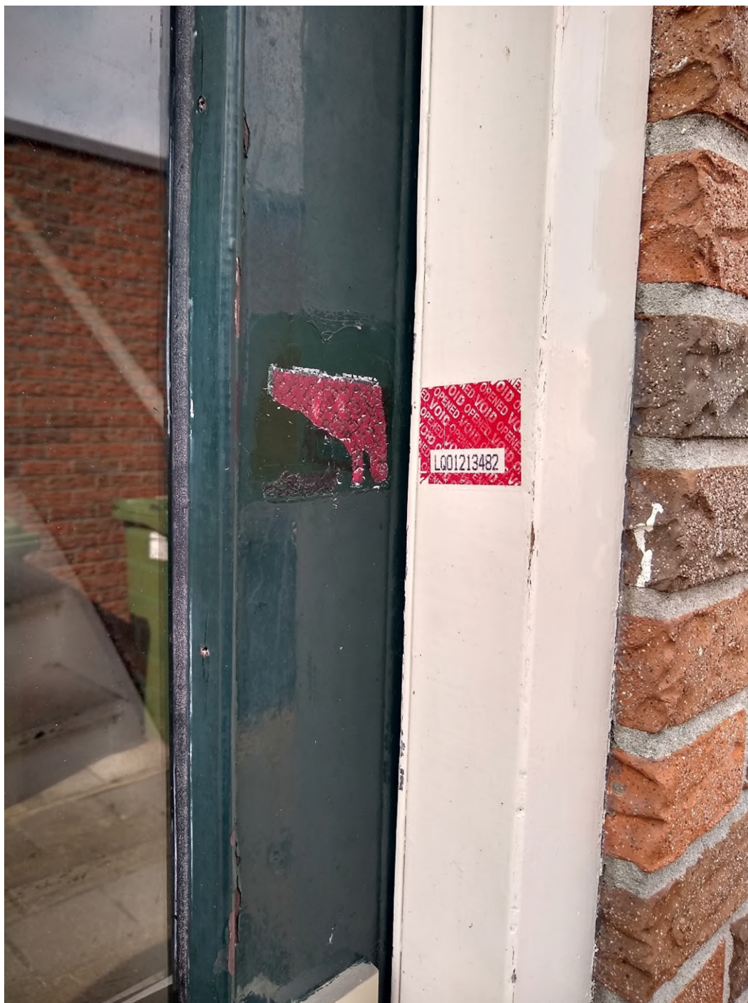
Foto 1 toegangsdeur met een verbroken zegel LQ01213482