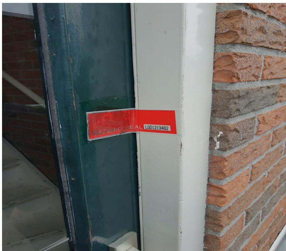
toegangsdeur is volledig afgesloten met een zegel LQ01213482